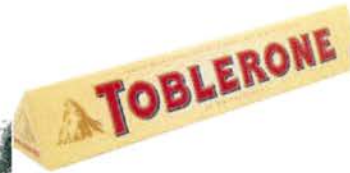
Prisma mit dreieckiger Grundfläche